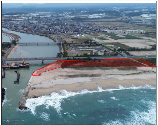
施工箇所（北側から南側撮影）