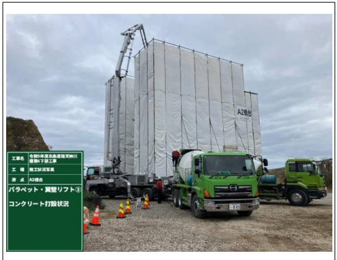
2月末現場状況（北栄工区 A2側）