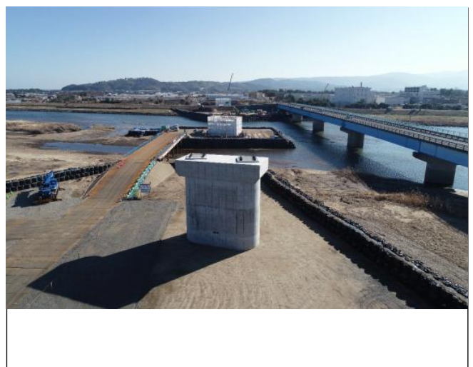
左岸側～右岸側を望む 遠景