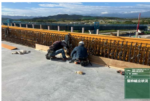
壁高欄型枠組立状況