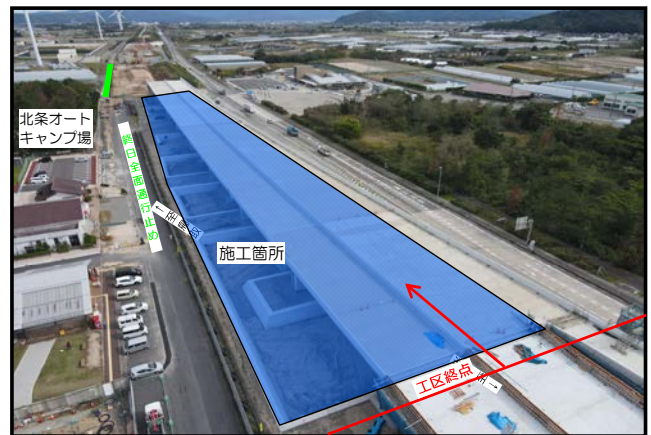
令和6年10月末（終点側より）