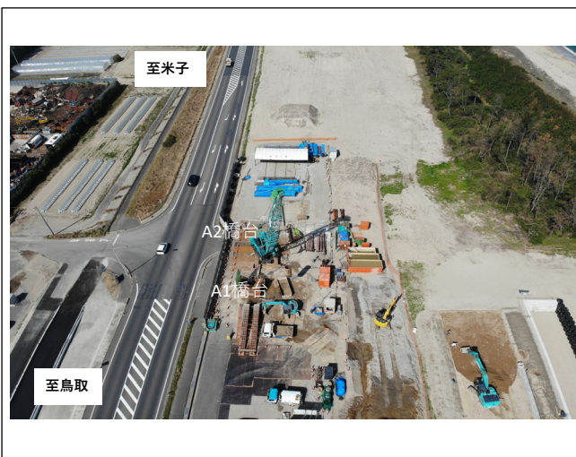
橋台施工箇所 全景（東側より西側を望む）