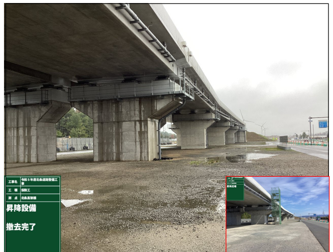
仮設工(昇降設備撤去)