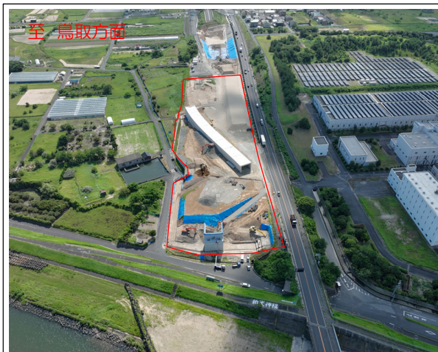
工事現場終点側より撮影