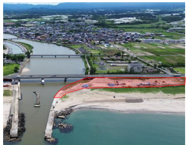
施工箇所（北側から南側撮影）