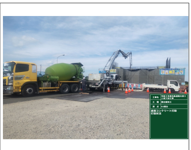
底版生コン打設状況