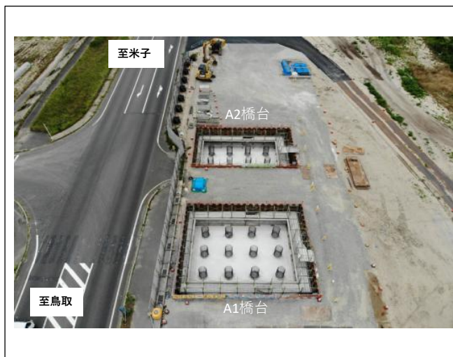
橋台施工箇所 全景（東側より西側を望む）