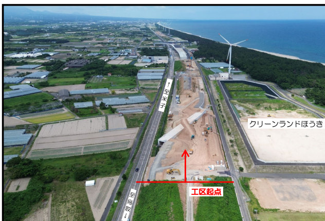
令和6年7月末（起点側より）